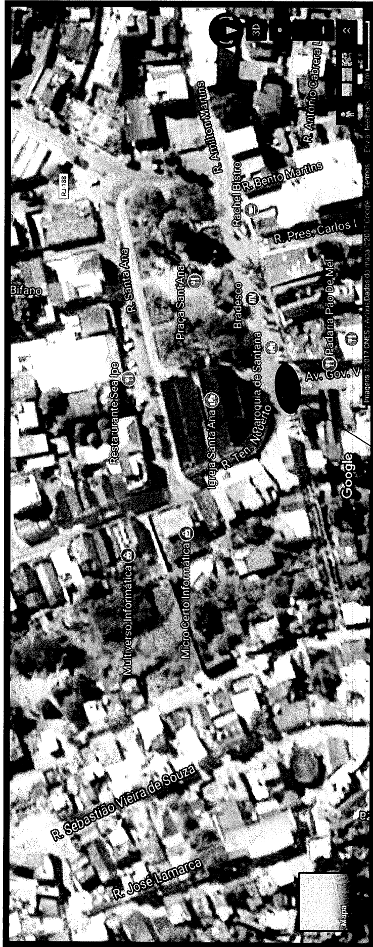
Largo da Matriz Monsenhor Waltencyr Alves Rodrigues